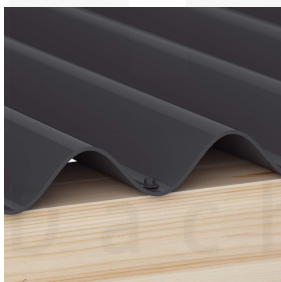
Optionale Befestigung in der Tiefsicke mit Schrauben (ca. 6 p/m 2 )