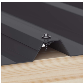
Überlappungen werden immer auf der Hochsicke befestigt (ca. 3 p/m 2 )