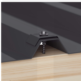
Befestigung auf der Hochsicke mit Kalotten und Schrauben (ca. 6 p/m 2 )

Nähere Informationen finden Sie in der Montageanleitung unter "Downloads".