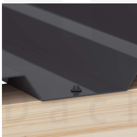
Optionale Befestigung in der Tiefsicke mit Schrauben (ca. 6 p/m 2 )