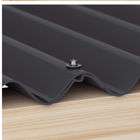
Überlappungen werden immer auf der Hochsicke befestigt (ca. 3 p/m 2 )