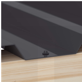
Befestigung in der Tiefsicke mit Schrauben (ca. 6 p/m 2 )

Nähere Informationen finden Sie in der Montageanleitung unter "Downloads".