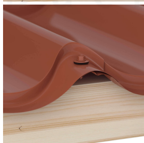
Überlappungen werden immer auf der Hochsicke befestigt (ca. 3 p/m 2 )