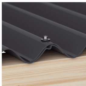
Überlappungen werden immer auf der Hochsicke befestigt (ca. 3 p/m 2 )