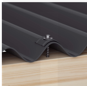
Befestigung auf der Hochsicke mit Kalotten und Schrauben (ca. 6 p/m 2 )

Nähere Informationen finden Sie in der Montageanleitung unter "Downloads".